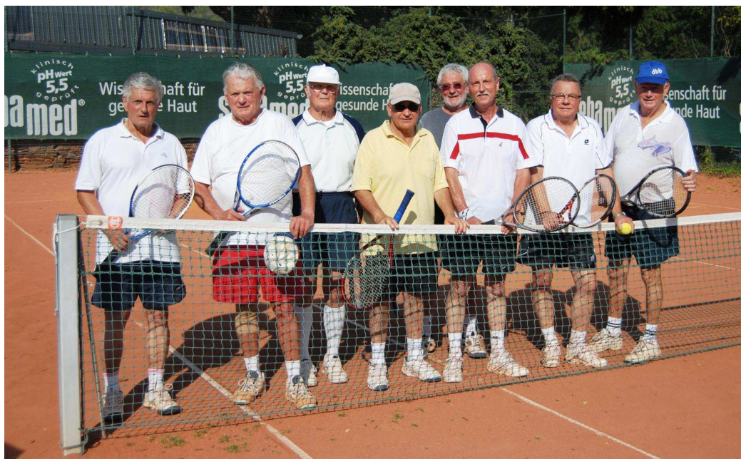
Ein Teil der „Dienstags-und-Freitags-Jungsenioren-Runde“

Während der Sommermonate trifft sich regelmäßig eine „gemischte Riege“ zum gemeinsamen Tennisspiel. Der Fotograf konnte sich von den hohen technischen Fertigkeiten der anwesenden Teilnehmer überzeugen – die Fotos zeigen einen Teil der „Herren-Abteilung“ beim Gruppenfoto und zwei „Vereins-Urgesteine“ in Aktion.