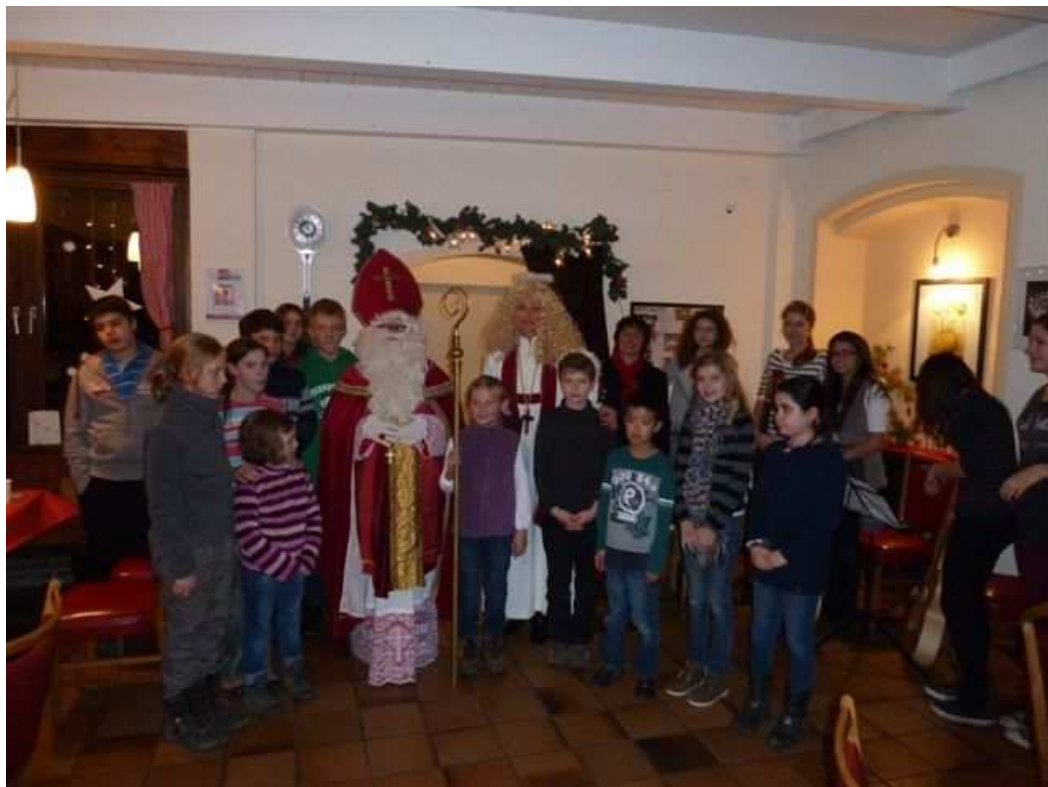
Der Nikolaus im Clubhaus